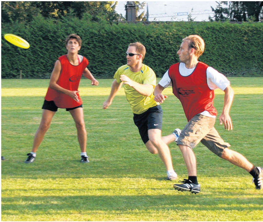
Ein ultimatives und polysportives Erlebnis: Beim Ultimate Frisbee wird im Team taktiert, viel gerannt und zwischendurch ist auch ein Luftsprung notwendig, um dem Gegner die «Wurfscheibe» abluhsen zu können.